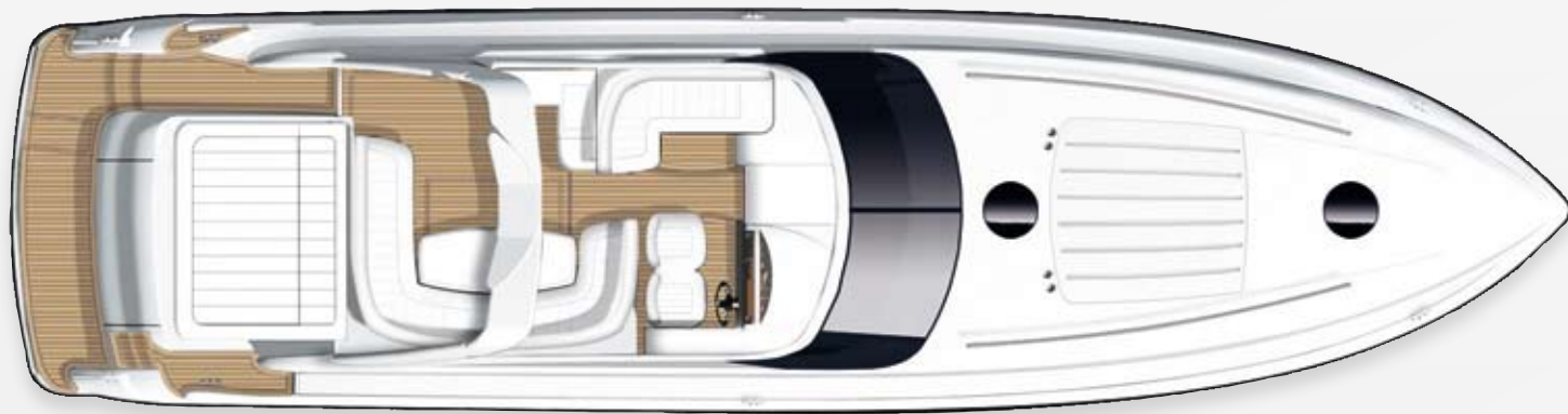
Layout des oberen Unterkunftsbereichs