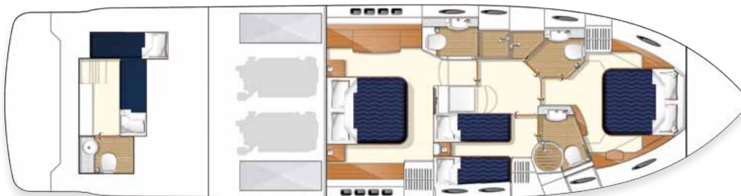
Distribución de camarotes inferiores