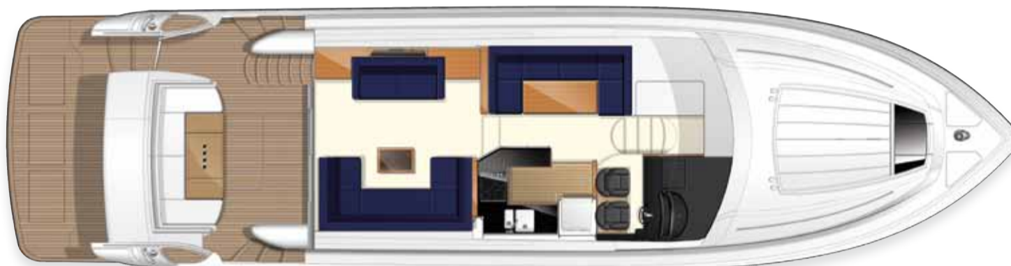
Distribución de camarotes superiores