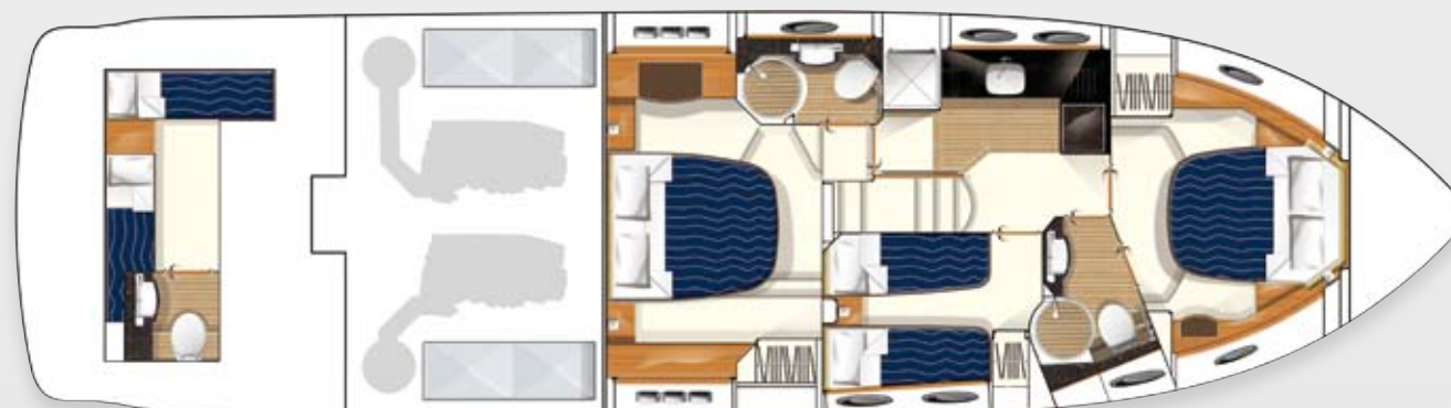
Layout des unteren Unterkunftsbereichs