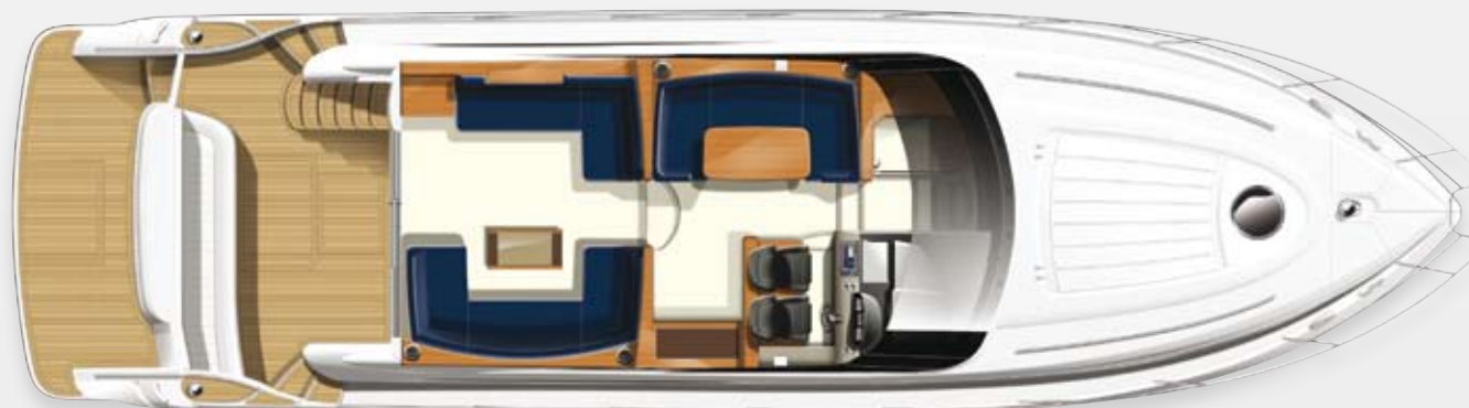
Layout des oberen Unterkunftsbereichs