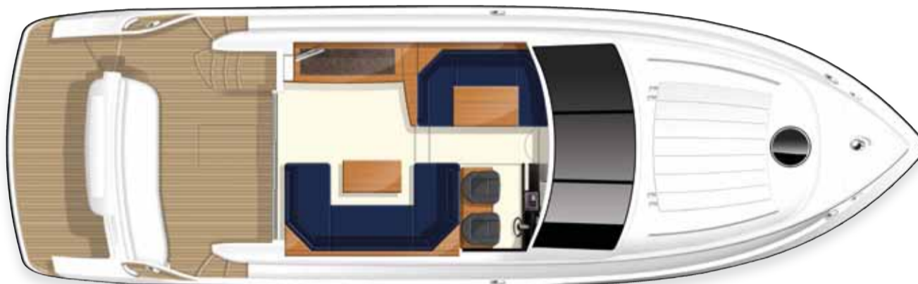
Layout des oberen Unterkunftsbereichs