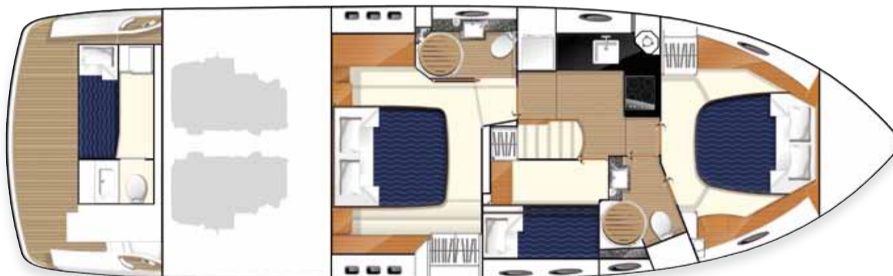
Layout des unteren Unterkunftsbereichs