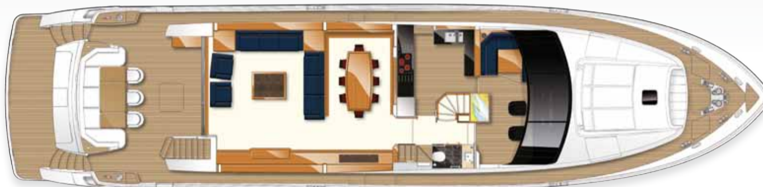
Layout des oberen Unterkunftsereichs