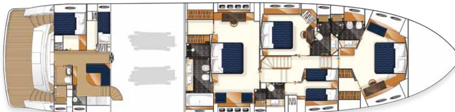
Layout des unteren Unterkunftsereichs