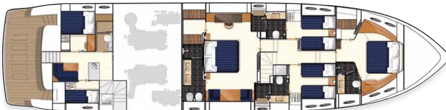
Layout des unteren Unterkunftsbereichs