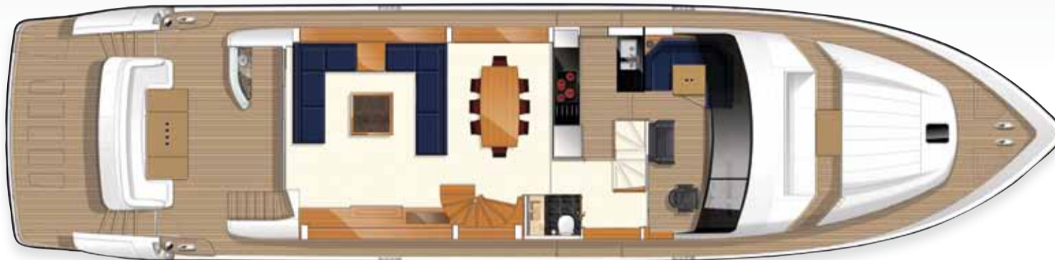
Layout des oberen Unterkunftsbereichs